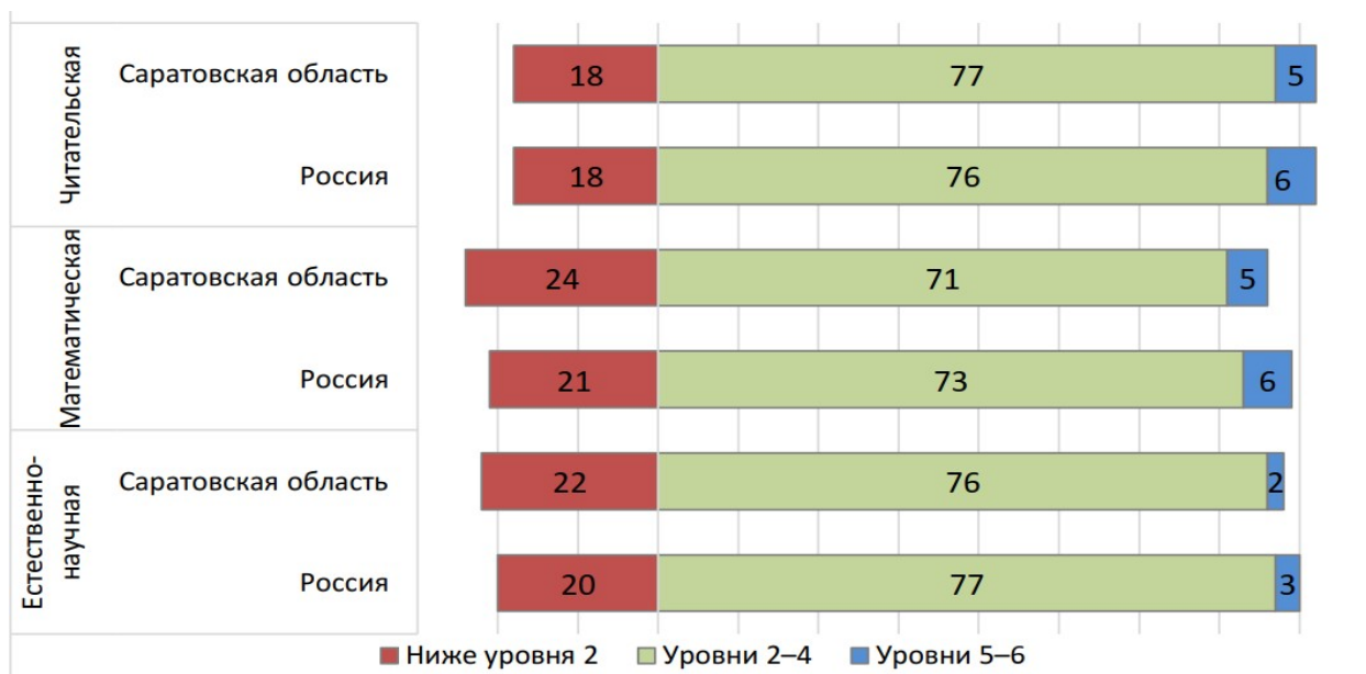
Рис.2. Распределение учащихся по уровням грамотности

Результаты анализа, представленные в таблице 5, показывают наличие некоторого образовательного неравенства. В развитии естественнонаучной грамотности оно проявляется в меньшей степени, чем в случае математической и читательской грамотности.